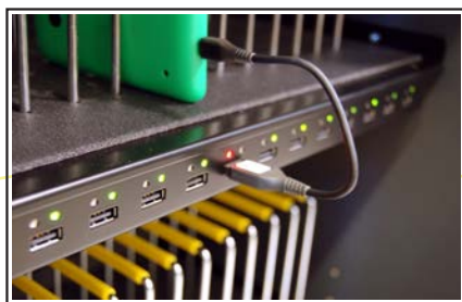
Naprava med polnjenjem