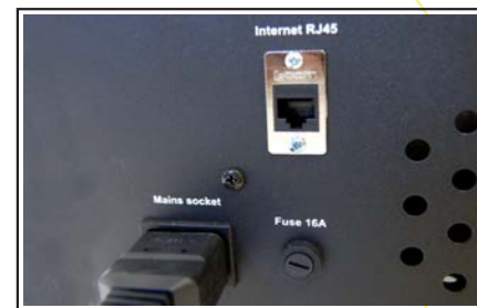
LAN konektor kot dostopna točka za router