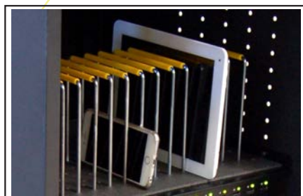
Separatorji za razdelitev naprav